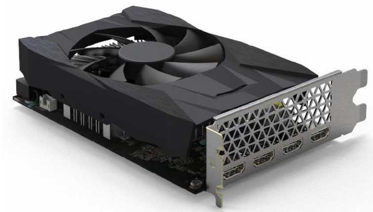
图 1 产品实物图（装配散热器）